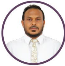
ئىشلىتىش ئۈچۈن ئىشلىتىش ئۈچۈن ئىشلىتىش ئۈچۈن