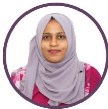
ئىشلىتىش ئۈچۈن ئىشلىتىش ئۈچۈن ئىشلىتىش ئۈچۈن