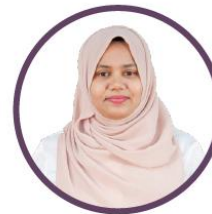
ئىشلىتىش ئۈچۈن ئىشلىتىش ئۈچۈن ئىشلىتىش ئۈچۈن