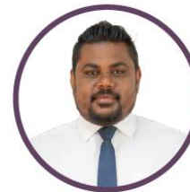
ئىشلىتىش ئۈچۈن ئىشلىتىش ئۈچۈن ئىشلىتىش ئۈچۈن