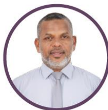
ئىشلىتىش ئۈچۈن ئىشلىتىش ئۈچۈن ئىشلىتىش ئۈچۈن