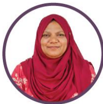
ئىشلىتىش ئۈچۈن ئىشلىتىش ئۈچۈن ئىشلىتىش ئۈچۈن