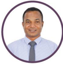
ئىشلىتىش ئۈچۈن ئىشلىتىش ئۈچۈن ئىشلىتىش ئۈچۈن

ئىشلىتىش ئۈچۈن تەييارلانغان بۇ كىتابنىڭ نىسبىتى