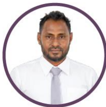
ئىشلىتىش ئۈچۈن ئىشلىتىش ئۈچۈن ئىشلىتىش ئۈچۈن