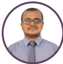
ئىشلىتىش ئۈچۈن ئىشلىتىش ئۈچۈن ئىشلىتىش ئۈچۈن