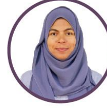
ئىشلىتىش ئۈچۈن ئىشلىتىش ئۈچۈن ئىشلىتىش ئۈچۈن