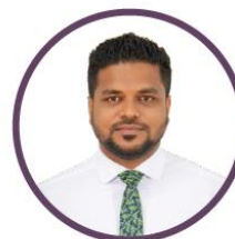
ئىشلىتىش ئۈچۈن ئىشلىتىش ئۈچۈن ئىشلىتىش ئۈچۈن