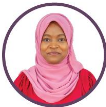
ئىشلىتىش ئۈچۈن ئىشلىتىش ئۈچۈن ئىشلىتىش ئۈچۈن