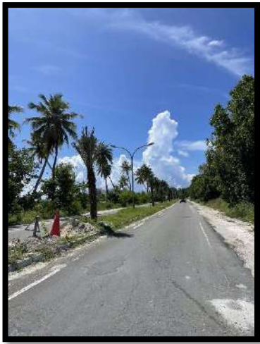
10. بېسىم - ئاستىدىكى يولنىڭ تەكشۈرۈلۈشى